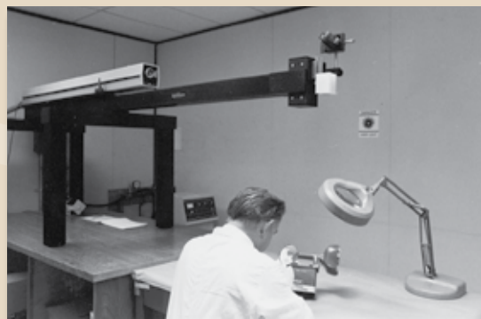
La Police provinciale devient une pionnière dans le monde en introduisant la détection des empreintes digitales par laser