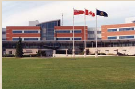
Le Grand quartier général de la Police provinciale, 1995