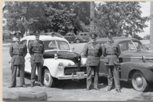
Les premières voitures de police, Kenora, 1942