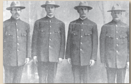
Photo de 1910 représentant des agents de la OPP